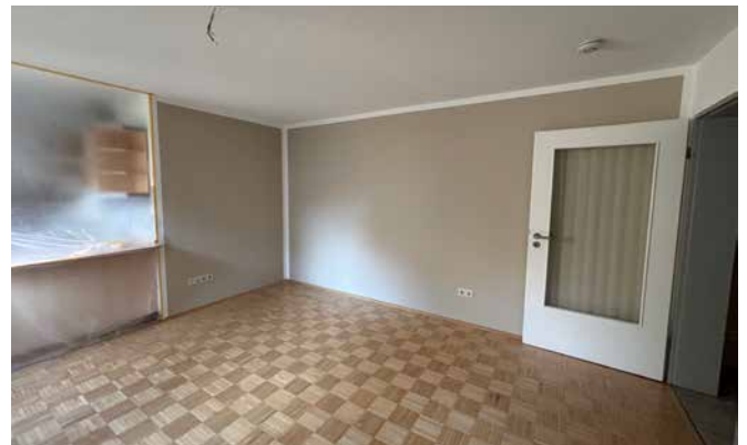
Zwischenstand Anfang November