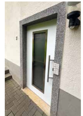
Im Kreuzseifen 5