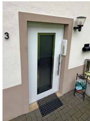
Im Kreuzseifen 3

Unsere Mieterinnen und Mieter der Mehrparteienhäuser Im Kreuzseifen 3 und 5 in Freudenberg dürfen sich nun über neue Hauseingänge freuen, das Haus Im Kreuzseifen 3 bekam dazu noch einen neuen Fassadenanstrich. Beides war in den vergangenen Jahren sichtlich gealtert, so dass wir nun Abhilfe schufen.