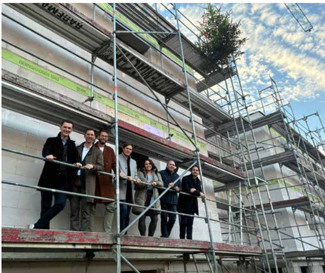
Richtfest der Kita im Birkenweg in Siegen-Eiserfeld

Im Birkenweg in Siegen-Eiserfeld war es am 6. November so weit. Nur wenige Wochen nach dem Spatenstich feierten wir gemeinsam mit zahlreichen Gästen das Richtfest für die neue Kindertagesstätte. Insgesamt entstehen vier neue Gruppenräume mit modernen Betreuungsbereichen, Bewegungsflächen und Außenanlagen für Kinder unter und über drei Jahren. In Aue-Wingeshausen am Standort An der Schule wehte die Richtkrone über dem Neubau bereits am 23. September. Diese Kita bietet ebenfalls in vier Gruppen Betreuungsplätze für Kinder von null bis sechs Jahren.