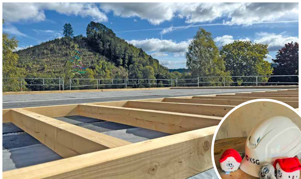
Richtfest der Kita in Aue-Wingeshausen am Standort An der Schule